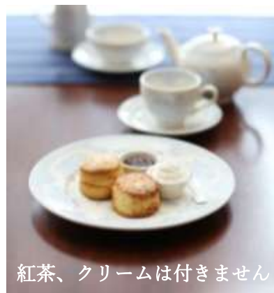
紅茶、クリームは付きません